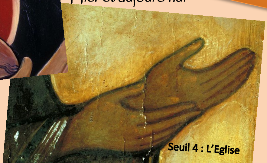
Seuil 4 : L'Eglise