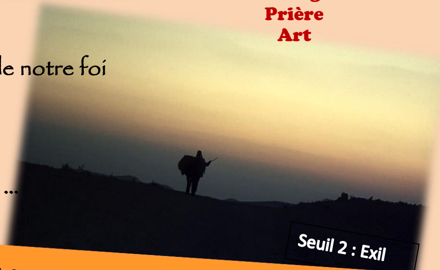
Seuil 2 : Exil

« Alors cette histoire, notre histoire, ton histoire, quelle est-elle ? »