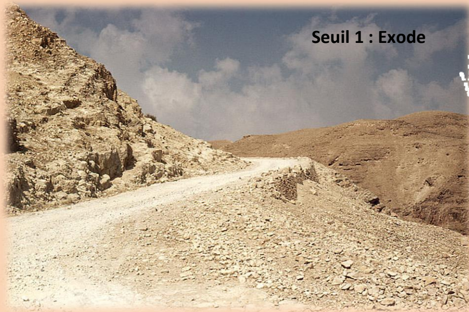
Seuil 1 : Exode