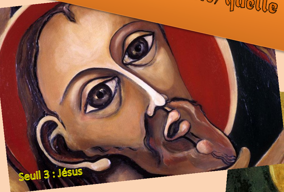
Seuil 3 : Jésus

« Alors cette histoire, notre histoire, ton histoire, quelle est-elle ? »